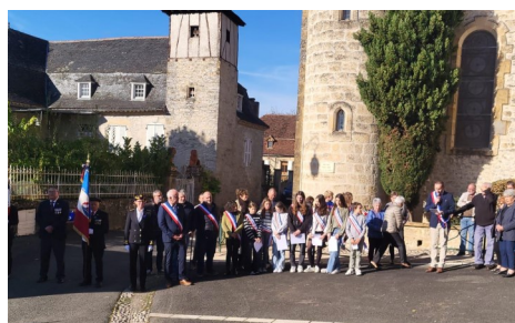
11 novembre : Une commémoration d'envergure cantonale