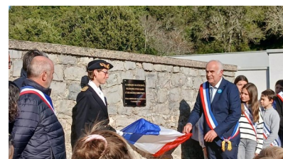
Dévoilement de la plaque commémorative