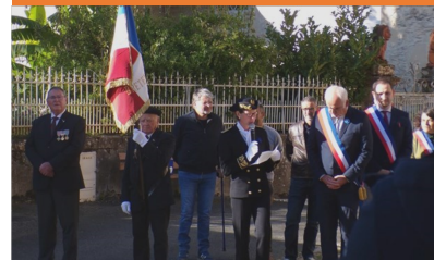
Lecture du discours par Madame la Sous-Préfète