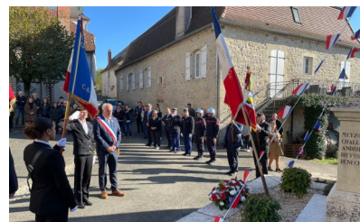
Salut fraternel au monument aux Morts