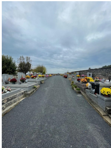
Les ajustements dans les cimetières avant la Toussaint