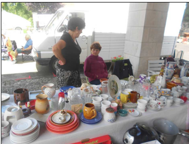
BROCANTE DE MAI ... Les fidèles à leur poste